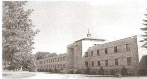
Reconnaissance à nos ancêtres Grand Séminaire de Nicolet 700, boul. Louis-Fréchette Nicolet, P. Québec J3T 1V5

L'Association remercie la générosité de nos commanditaires dont la liste apparaît dans nos pages 9, 10 & 11